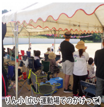
りん小(広い運動場でのかげっこ)

9月9日(土)に町内3小学校の運動会が秋晴れの下、実施されました。町長、教育長、事務局長と共に私も観戦しました。まず、りんどうヶ丘小学校を訪れました。大会スローガンは、「2017年50人の全力!最後まであきらめない運動会」です。開会式での子どもたちの凛とした態度に感心しました。壇上であいさつする人にサッと体を向けて聞きました。