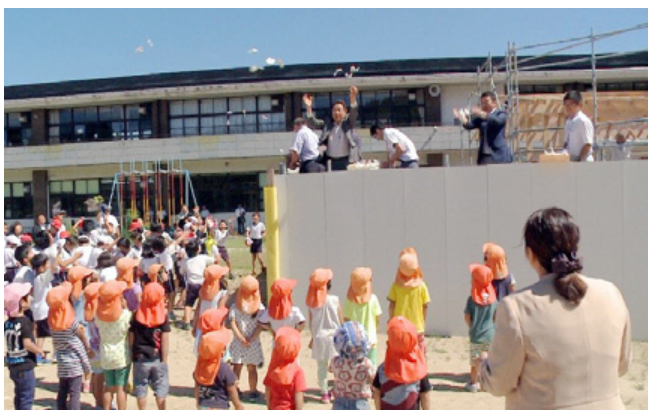
建物の骨組みからの「ひとぎ投げ」の様子