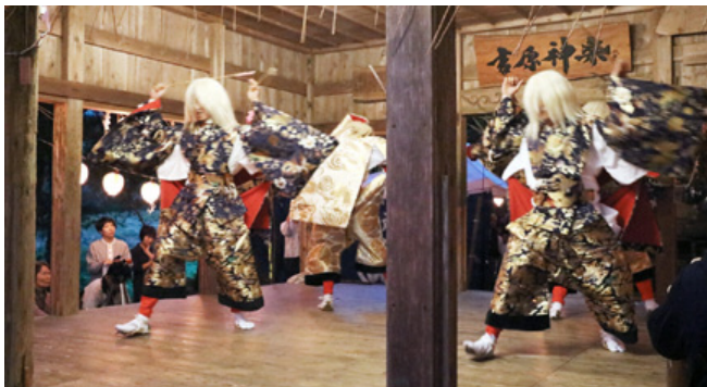
力強く神楽を舞う保存会メンバー