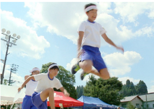
大きくジャンプする6年生