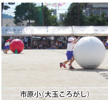
市原小(大玉ころがし)

次に市原小学校を訪れました。大会スローガンは、「つなぐれ100人の絆」最後まで力を出し切りいざ勝負」です。