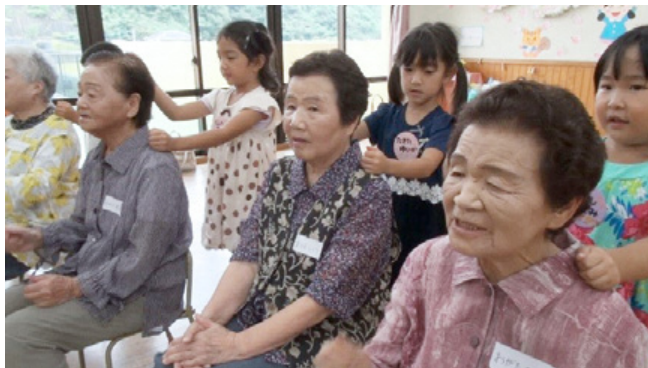
童謡にあわせて肩たたきをする子どもたち