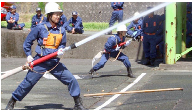
ポンプ車の部で優勝した第3分団8部(黒川)