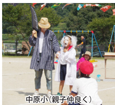
中原小(親子仲良く)

輪 笑顔あふれる最高の運動会へ」です。力を合わせ大きな声で演技した紅白応援合戦には感動しました。