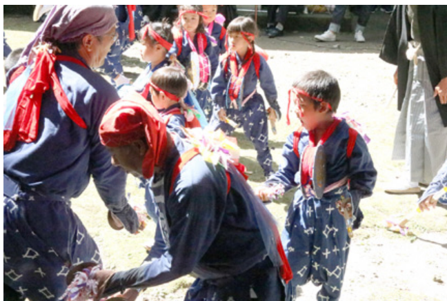
中原熊野座神社で楽を奉納する子どもたち