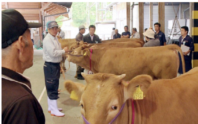
審査を受ける牛を見守る農家の様子