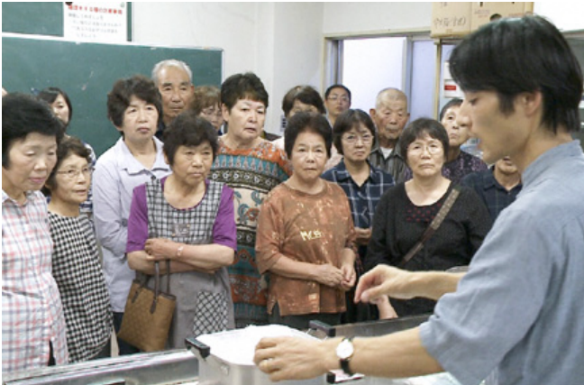
麴づくりの実演を熱心にみる参加者