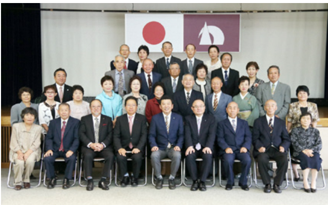
笑顔で記念撮影をする16組の金婚夫婦