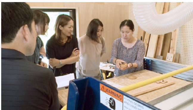
説明を受ける参加者たち