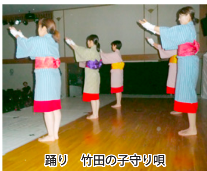
踊り 竹田の子守り唄

私も高知市教育委員会の教育長役で出演しました。緊張しましたが、本番を終えた時は、なんとも言えない満足感がありました。