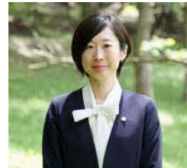
株式会社桜小路 中小企業診断士

「中小企業診断士のいる映像制作会社」として、経営支援事業・映像制作事業を展開。自社での企業SNS運用支援実務を通じ、SNSの活用や効果的な発信方法について熊本県内各地のセミナーで講師を務める。