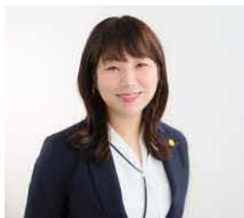
大村中小企業診断士事務所 中小企業診断士

熊本県内の金融機関にて約23年間勤務し、融資業務や経営相談、伴走支援に従事。事業者への提案を行うなど、営業活動にも携わり、創業から事業承継まで幅広い支援に関わる。