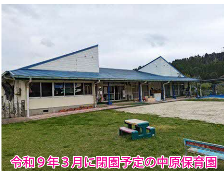
令和9年3月に閉園予定の中原保育園