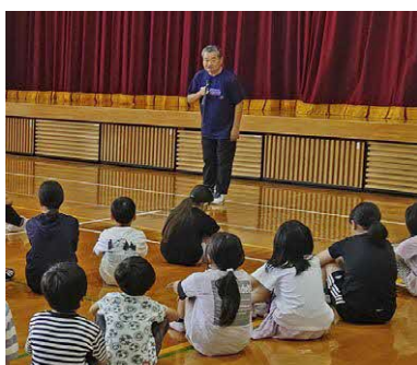
会長として組織を牽引しつつ、自らも指導者として総合型スポーツの参加者約30名と汗を流されています

2002年度から小学校では土曜日が休日になりました。そこで、子ども達の居場所づくりや社会性を身につける取り組みが必要となり、わくわくク