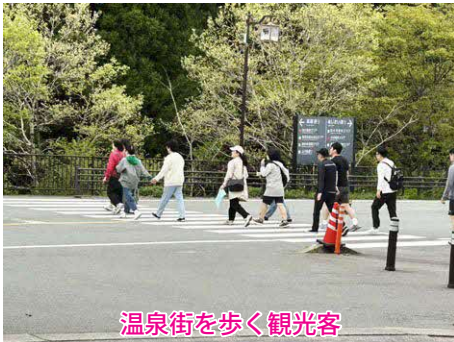
温泉街を歩く観光客

問 昨年より地方創生の3名の伴走支援員チームが配置され1年が経過しました。南小国においては「南小国の未来を支える、住む人、訪れる人に優しい移動手段を考える」というテーマでの支援を受けているが具体的な計画があるのか？ 町長 検討の論点・既存のタクシー利用の状況（補助事業、時間外等）・交通空白地の交通手段の確保等を踏まえタクシー利用券の見直しとライドシェアの検討を進めている。 問 ライドシェアを導入し、黒川の大型駐車場を拠点とすることでパークアンドライドが可能になる。EV車両や防災倉庫を設置すれば観光客の避難所としての防災機能も有効になるのでは？ 総務課長 防災倉庫や電気自動車も含めて今後考えていきたい。 町長 観光危機管理等、防災士の養成講座を計画しているSMOと連携して今後進めていく。