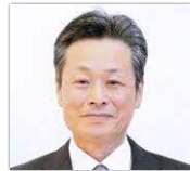
穴井 則之 議員