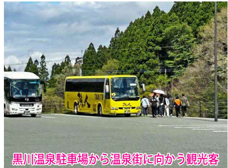
黒川温泉駐車場から温泉街に向かう観光客