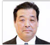
北里 桂一 議員