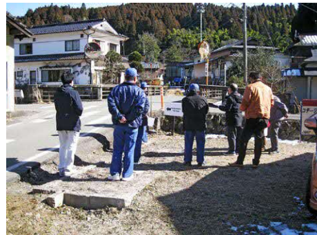
現地は県道と町道が直角交差となっている

令和7年12月12日付けで提出されました、陳情第10号「町道志津、志童子線道路改良工事」依頼につきましては付託後、現地において、陳情者並びに用地権者同席の上、陳情内容の検討を行い、改修工事の必要があると判断しましたので採択となりました。