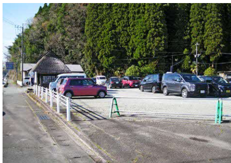
建設予定地 (管理センター跡地)

【答】 当初は会議室程度の建築物を造るつもりだったが、事務室や災害時の仮設住宅などにも使えるよう、トイレやキッチンを備えた建築物を造ることとした。また資材や人件費の高騰もあり、結果的に予算が増大した。