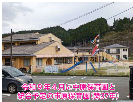
令和9年4月に中原保育園と統合予定の市原保育園（築37年）