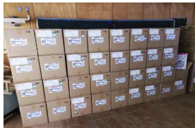
旧星和小に備蓄している簡易ポータブルトイレ