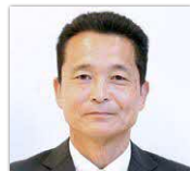
井野 和哉 議員