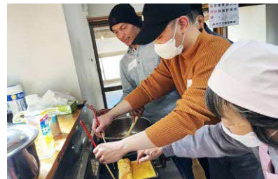
令和7年度に初開催した、食生活改善推進員さんと外国人との食を通した交流会の様子