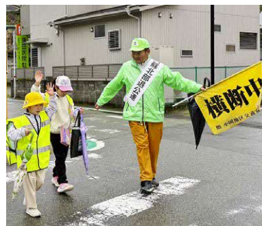
登校する子ども達に「今日も元気？」 「いつも挨拶が丁寧だね」と声掛けをしながら見守りをされています

ラブが発足しています。地域の方が指導者として得意なことや学んできたことを教えることで、世代を超えた交流や生きがいづくりになればというのも目的の一つです。